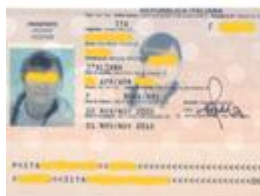
Passaporto "con foto digitale"