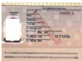
Passaporto "a lettura ottica"