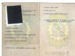
Passaporto "non a lettura ottica"

Ricordiamo che per usufruire del programma "Visa Waiver Program" (Viaggio senza visto) è necessario: