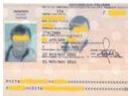
Passaporto "con foto digitale"