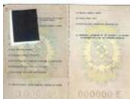
Passaporto "non a lettura ottica"

Ricordiamo che per usufruire del programma "Visa Waiver Program" (Viaggio senza visto) è necessario: