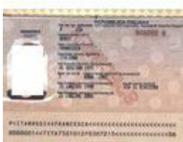
Passaporto "a lettura ottica"